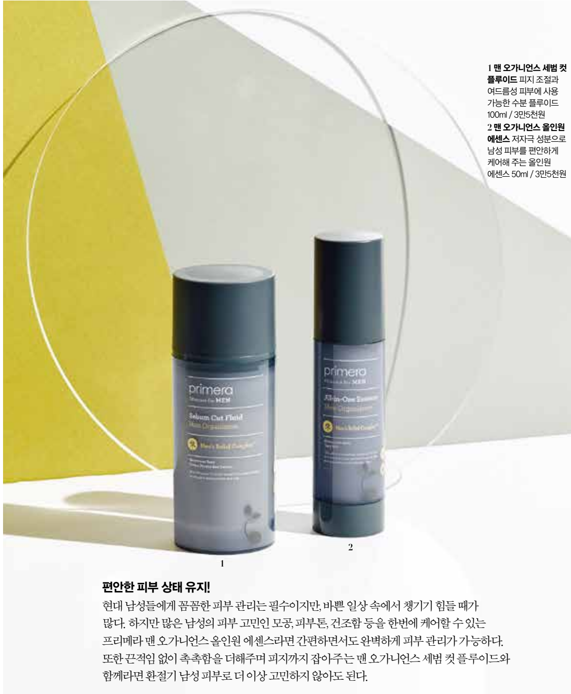
1 맨 오가니언스 세뱀 컷 플루이드 피지 조절과 여드름성 피부에 사용 가능한 수분 플루이드 100ml / 3만5천원 2 맨 오가니언스 올인원 에센스 저자극 성분으로 남성 피부를 편안하게 케어해 주는 올인원 에센스 50ml / 3만5천원