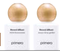
내추럴 디퓨저 천연 유래 100% 에센셜 오일 향을 블렌딩한 디퓨저 화이트 부토니에(그윽한 향), 써니 시트러스 가든(상쾌한 향) 120ml / 25,000원 (디퓨저 스틱 별도 판매)