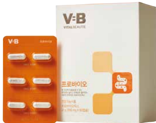
프로바이오 장 내 세균의 밸런스를 찾아주는 장 건강 솔루션 350mg×60캡슐/65,000원

오메가케어 두뇌, 망막의 구성 성분이자 혈행과 중성 지질 개선에 도움을 줄 수 있는 오메가 지방산 제품 550mg×120캡슐/45,000원 자음환 홍삼과 14가지 전통 식물 성분(부원료)이 함유된 환 타입 제품 3.75g×30환/110,000원 홍삼진액청(淸) 대나무 숯 필터 정제수로 농축한 100% 순수 홍삼 농축액 200g/140,000원 천삼액 천삼화 홍삼과 전통 식물성분(부원료)이 깊은 조화를 이룬 고(膏)타입 파우치 제품 15g×30포/80,000원 명작수 천삼화 홍삼과 진생베리(부원료)를 고스란히 담은 고농축 앰플 20g×45앰플/230,000원