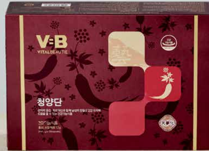
청양단 면역력 증진, 피로개선과 함께 남성의 전립선 건강 유지에 도움을 줄 수 있는 건강기능식품 600mg x 120캡슐 / 110,000원