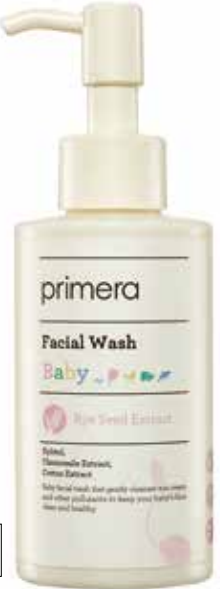
베이비 페이스 워시 선크림 및 피부 노폐물을 부드럽게 제거하여 아이 피부를 깨끗하고 건강하게 지켜주는 베이비 페이스 워시 150ml / 20,000원