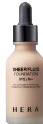
헤라 쉬어 플루이드 파운데이션 / 23호 트루베이지 끈적임없이 보송보송하게 마무리되어 컬러 메이크업의 발색력과 지속력을 높여주는 파운데이션 30ml / 4만5천원