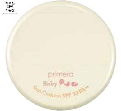
베이비 선 쿠션 연약한 아이 피부를 지켜주는 간편한 쿠션 타입의 선크림 15g / 25,000원 (리필 20,000원)