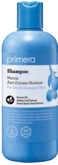
마롤라 안티-드라이니스 모이스처 샴푸 탁월한 보습력의 마롤라 오일이 수분 손실을 예방해주고 모발을 촉촉하게 가꾸어주는 샴푸 300ml / 25,000원