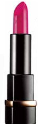
헤라 루즈 홀릭 크림 텍스처 / 191호 엔틱 퍼플 고급스러운 자주빛 컬러 그대로 입술에 발색되는 매혹적인 컬러의 립스틱 3g / 3만5천원