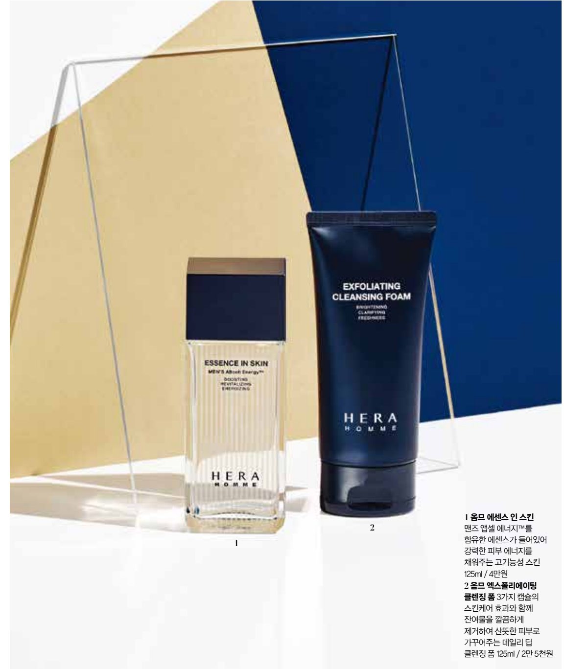
1 올드 에센스 인 스킨 맨즈 앰셀 에너지™를 함유한 에센스가 들어있어 강력한 피부 에너지를 채워주는 고기능성 스킨 125ml / 4만원 2 올드 엑스폴리에이팅 클렌징 폼 3가지 캡슐의 스킨케어 효과와 함께 잔여물을 깔끔하게 제거하여 산뜻한 피부로 가꾸어주는 데일리 딥 클렌징 폼 125ml / 2만 5천원

메이크업에 관심 갖는 남성들이 많아진 요즘, 메이크업보다 신경 써야 할 것은 바로 세안이다. 헤라 엑스폴리에이팅 클렌징 폼에는 파파인 효소, 비타민E 유도체, 해양 추출물의 3가지 캡슐이 함유되어 있어 한번의 세안으로 미세먼지, 각질, 모공 속 노폐물, 선크림과 BB/CC크림의 잔여물까지 깔끔하게 세안이 가능하다. 세안 후에는 헤라 에센스 인 스킨으로 촉촉하고 윤기 나는 피부로 마무리한다.