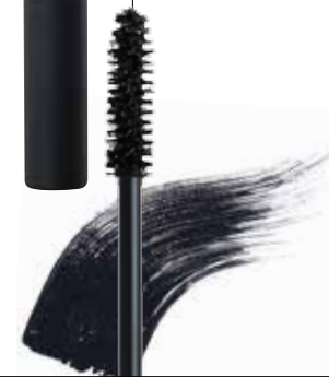
헤라 리치 스퀴즈 마스크라 / 79호 래쉬블랙 얇은 모와 굵은 모가 혼합된 브러시로 극강 볼륨의 속눈썹을 연출해 준다 6g / 3만5천원

극강 볼륨의 속눈썹을 연출할 수 있는 마스크라. 제품을 주물러 항상 처음처럼 사용할 수 있다.