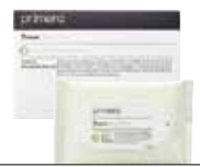
후리앤후리 티슈 야외 활동 시 산뜻하게 사용할 수 있는 펄프 소재의 천연 유래 성분 함유 휴대용 여성 청결 티슈 6매×10팩 / 15,000원