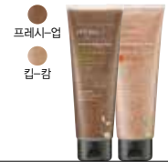
아로마 바디 스크럽 워시 천연 스크럽 성분이 함유된 바디 피부의 각질 제거를 해주는 바디 스크럽 워시 프레시-업, 킵-킵 2종 230ml / 25,000원