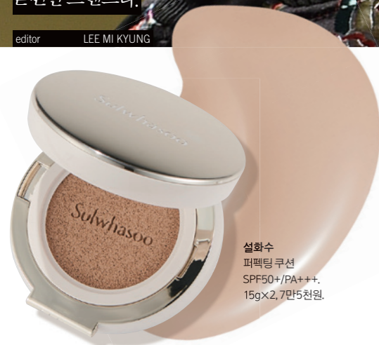
설화수 퍼펙팅 쿠션 SPF50+/PA+++, 15gX2, 7만5천원.