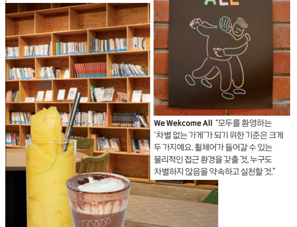
We Welcome All "모두를 환영하는 '차별 없는 가게'가 되기 위한 기준은 크게 두 가지예요. 휠체어가 들어갈 수 있는 물리적인 접근 환경을 갖춘 것, 누구도 차별하지 않음을 약속하고 실천할 것."

주소 서울시 은평구 통일로 684 1층 영업시간 월~금요일 09:00~18:00, 토요일 휴업 문의 @window_cafe_byulkkol