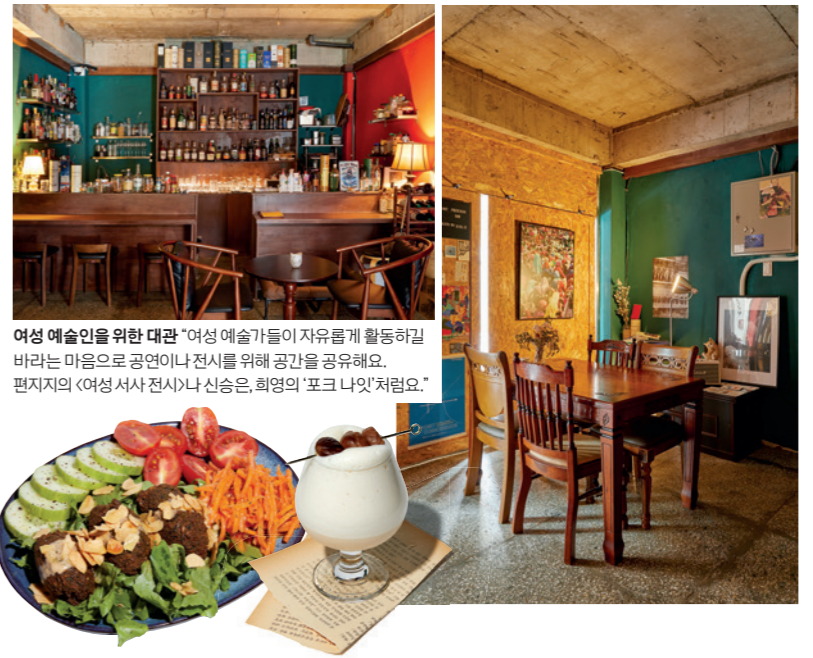
여성 예술인을 위한 대관 "여성 예술가들이 자유롭게 활동하길 바라는 마음으로 공연이나 전시를 위해 공간을 공유해요. 편지지의 <여성 서사 전시>나 신승은, 최영의 '포크 나잇'처럼요."

주소 서울시 마포구 동교로12길 12 1층 영업시간 화~수요일 14:00~22:00, 토요일 14:00~22:00, 월~목요일 휴업 문의 @pointfrederick