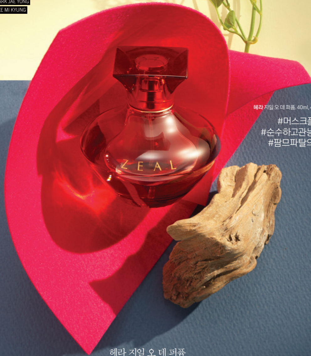
헤라 지일 오 데 퍼퓸. 40ml, 4만2천원.