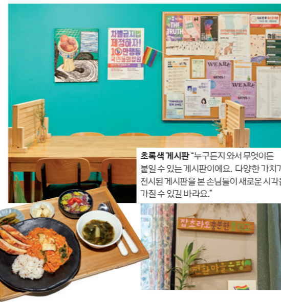
초록색 게시판 "누구든지 와서 무엇이든 붙일 수 있는 게시판이에요. 다양한 가치가 전시된 게시판을 본 손님들이 새로운 시각을 가질 수 있길 바라요."