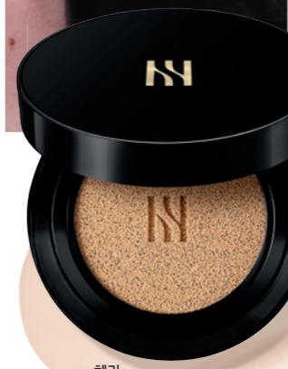
헤라 블랙쿠션 SPF34/PA++, 15gX2, 6만원.