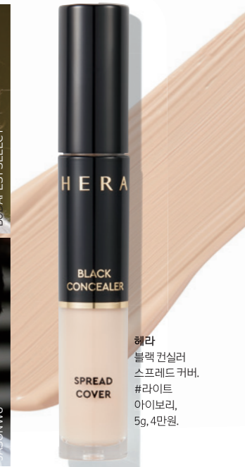
헤라 블랙 컨실러 스프레드 커버. #라이트 아이보리, 5g, 4만원.

정 효과가 있는 메이크업 베이스를 사용하는 것도 화장이 두꺼워지는 것을 막는 효과적인 방법이다. 메이크업 단계는 늘어나지만 보정 효과가 있는 메이크업 베이스를 얇게 펴 바르면 피부 결점이 어느 정도 가려지면서 여러 번 덧바르거나 추가로 보정하는 과정이 줄어들기 때문이다. 라벤더나 그린 등 컬러를 피부 상태에 맞춰 선택하면 베이스를 더욱 깔끔하고 예쁘게 다질 수 있다. 어쩔 수 없이 덧발라야 하는 경우에는 밀착력이 우수하면서 얇고 자연스럽게 마무리 되는 제품을 선택하는 것이 현명하다. 특히 맨 살처럼 자연스럽게 보정되는 파운데이션은 이번 시즌 트렌드에 가까운 피부 표현을 완성하기 좋다. 또 스킨케어 성분을 풍부하게 함유한 제품은 마스크 착용으로 수분을 빼앗기기 쉬운 피부 보호에도 효과적이다.