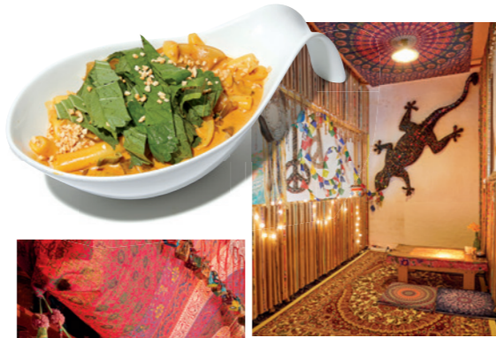
당신의 아지트 "편하게 와서 스미듯 머물 수 있는 모두의 아지트같은 곳이 되길 바라요. 어떤 모습이어도 차별받지 않는 안전한 공간이요."

주소 서울시 마포구 토정로4길 25 지하 1층 영업시간 화~일요일 13:00~22:00, 월요일 휴업 문의 @thecloset_vv