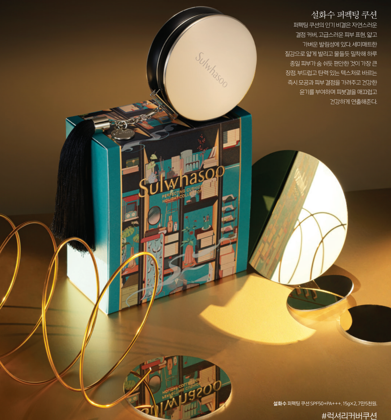
설화수 퍼펙팅 쿠션 SPF50+PA+++, 15g×2, 7만5천원.

피부 속 에너지를 깨워 힘있게 빛나는 피부를 선사하는 첫 단계 에센스인 윤조에센스는 피부 장벽을 튼튼하게 하는 동시에 안티에이징 효과를 배가하고 싶을 때 제격. Youth Master Technology™로 피부 장벽을 안과 밖에서 다각도로 케어해 피부 보호력과 방어력을 높이고 탄탄하게 빛나는 피부로 가꿔준다.