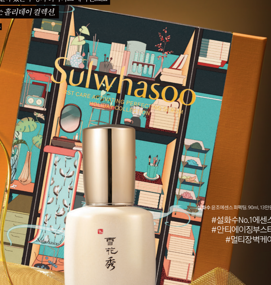
설화수 윤조에센스 퍼펙팅, 90ml, 13만원.

photographer PARK JAE YONG editor LEE MI KYUNG