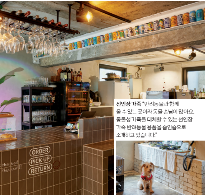
선인장 가족 "반려동물과 함께 있을 수 있는 곳이라 동물 손님이 많아요. 동물성 가족을 대체할 수 있는 선인장 가족 반려동물 용품을 손님으로 소개하고 있습니다."