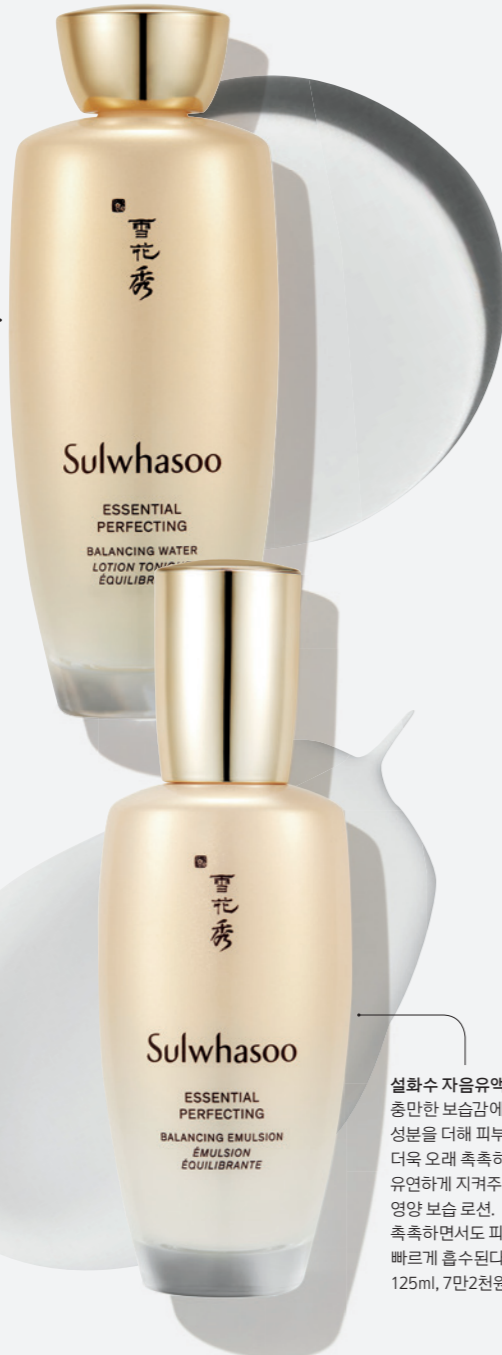
설화수 자음수 퍼펙팅 & 자음유액 퍼펙팅

설화수 자음수 퍼펙팅 편안하고 촉촉하게 보습하고 영양을 공급해주는 자음보습단™과 영양혼중수를 담아 건조로 인한 수분 고갈을 해소해 피부 바탕을 건강하게 다져준다. 쫄쫄한 젤 타입 텍스처가 피부에 매끄럽게 스며드는 스킨. 150ml, 6만8천원.